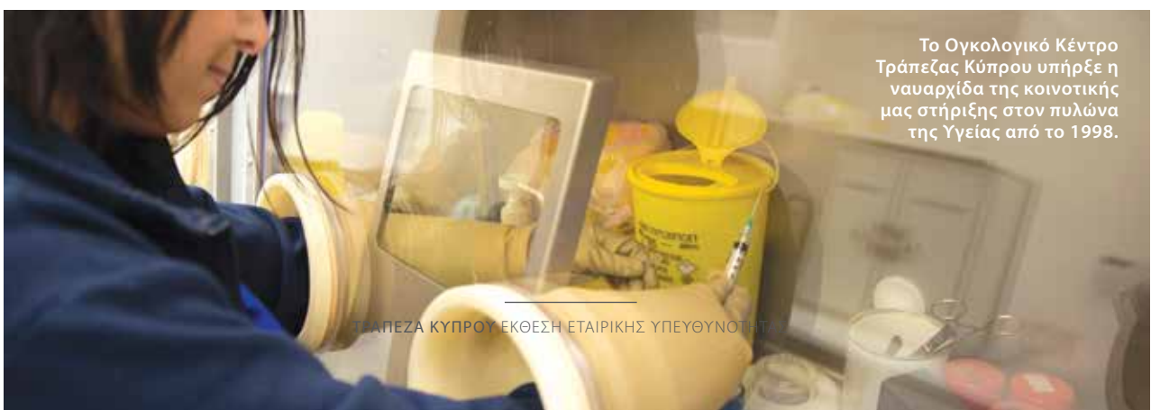
Το Ογκολογικό Κέντρο Τράπεζας Κύπρου υπήρξε η ναυαρχίδα της κοινοτικής μας στήριξης στον πυλώνα της Υγείας από το 1998.