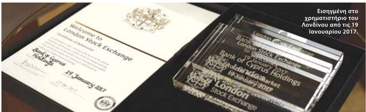
Εισηγμένη στο χρηματιστήριο του Λονδίνου από τις 19 Ιανουαρίου 2017.

Αυτή η νέα κουλτούρα αξιών της νέας μας Τράπεζας αποτελεί το σήμα κατατεθέν της σχέσης με τους μετόχους, τους πελάτες, τις Ρυθμιστικές Αρχές και τα άλλα ενδιαφερόμενα μέρη μας.