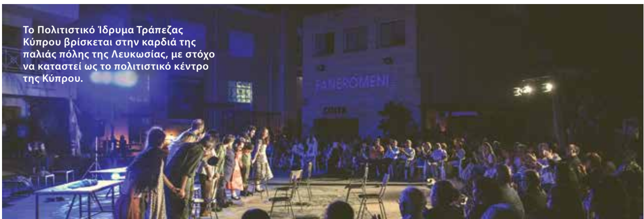
Το Πολιτιστικό Ίδρυμα Τράπεζας Κύπρου βρίσκεται στην καρδιά της παλιάς πόλης της Λευκωσίας, με στόχο να καταστεί ως το πολιτιστικό κέντρο της Κύπρου.

Το 2017 υποστηρίξαμε πάνω από 180 Μη Κυβερνητικούς Οργανισμούς, φιλανθρωπικές οργανώσεις, συνδέσμοις, δήμους, σχολεία, αθλητικές ομοσπονδίες και αθλητικές ακαδημίες με ποσό ύψους €1,2 εκατομμυρίων.