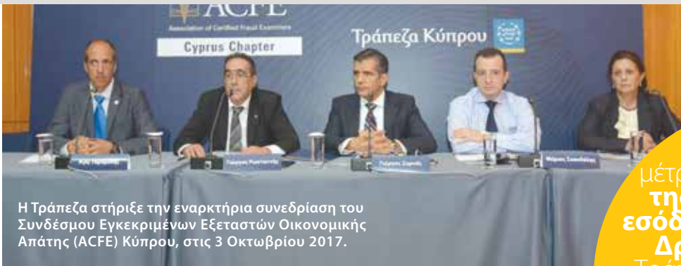
Η Τράπεζα στήριξε την εναρκτήρια συνεδρίαση του Συνδέσμου Εγκεκριμένων Εξεταστών Οικονομικής Απάτης (ACFE) Κύπρου, στις 3 Οκτωβρίου 2017.

Με βάση τα μέτρα Καταπολέμησης της Νομιμοποίησης εσόδων από Παράνομες Δραστηριότητες , η Τράπεζα απέρριψε 1,354 δυνητικούς πελάτες και ανέστειλε τη συνεργασία με πελάτες σε 2,401 περιπτώσεις, εκ των οποίων 1,862 είχαν τερματιστεί.