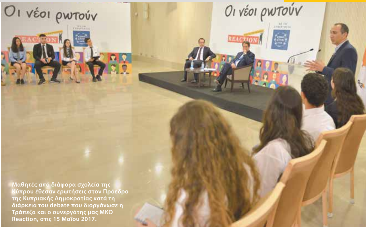
Μαθητές από διάφορα σχολεία της Κύπρου έθεσαν ερωτήσεις στον Πρόεδρο της Κυπριακής Δημοκρατίας κατά τη διάρκεια του debate που διοργάνωσε η Τράπεζα και ο συνεργάτης μας ΜΚΟ Reaction, στις 15 Μαΐου 2017.

του Αρχιεπισκόπου Κύπρου, του Προέδρου της Βουλής των Αντιπροσώπων, του Υπουργού Υγείας και παικτών της εθνικής ομάδας ποδοσφαίρου. Συμμετείχαν συνολικά πέραν των 500 μαθητών.