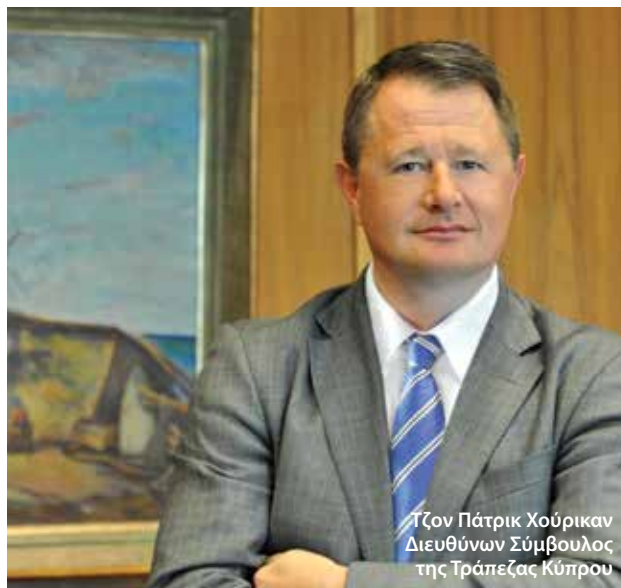
Τζον Πάτρικ Χούρικαν Διευθύνων Σύμβουλος της Τράπεζας Κύπρου